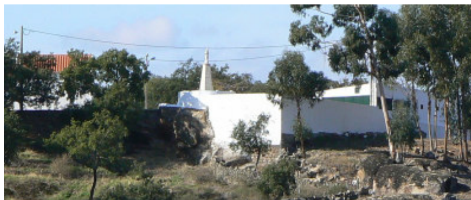
Fotografia do Miradouro D. Félix Nisa Ribeiro tirada a partir do adro da Igreja matriz de Proença