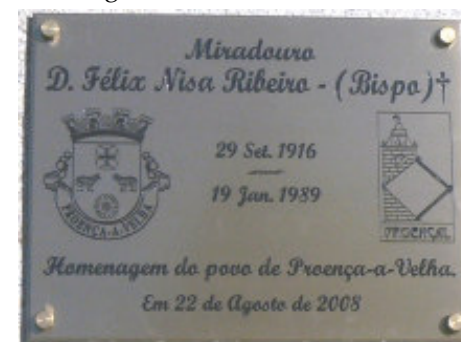
Placa comemorativa colocada no pedestal do monumento

seus irmãos, sobrinhos e familiares, o pároco da freguesia, o Presidente da Junta, o Presidente da Câmara e o Vereador das Obras e muitas pessoas de Proença que se quiseram associar a esta homenagem.