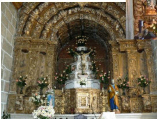
Fotografia do altar-mor no dia 9 Novembro 2008.