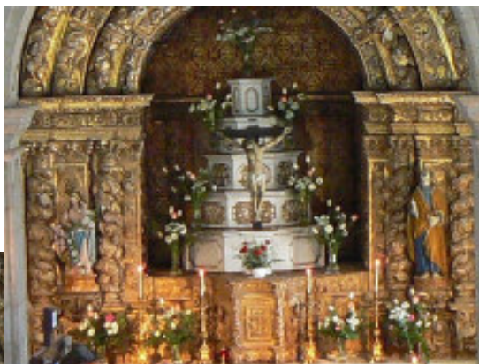
Fotografia do altar-mor no dia da Festa do Senhor do Calvário - 24 Agosto 2008.

Proença-a-Velha está mais pobre! Um grupo de ladrões assaltou a Igreja matriz e roubou algumas peças de valor, entre elas a imagem do Divino Espírito Santo, quatro colunas de talha dourada, do altar mor e quatro imagens de anjos dos altares laterais.