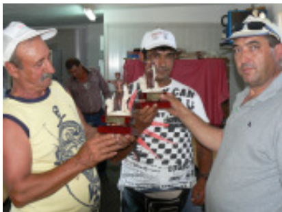
Os vencedores da Petanca.

Como vem sendo habitual à componente desportiva juntou-se a gastronómica, em almoços de convívio entre os atletas e alguns proencenses que se quiseram associar à festa.