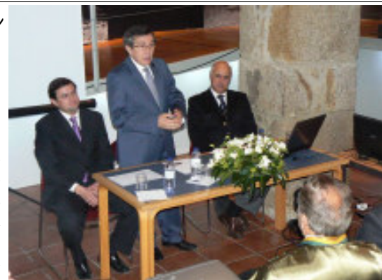
Cerimónia Inaugural do VI Festival do Azeite e Fumeiro

O Festival contou com a presença de várias entidades, com destaque para o Secretário de Estado do Comércio, Serviços e Defesa do