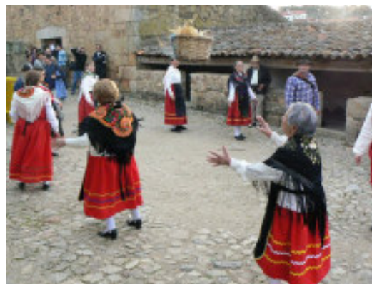
"Modas e Adufes" recriando Jogos de Entrudo.

Logo de seguida, na Terça-feira de Carnaval, como vem sendo hábito nos últimos anos, Proença-a-Velha esteve